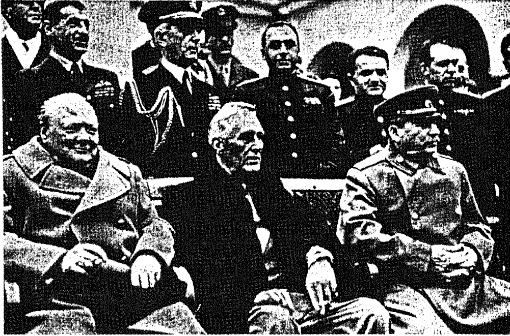
أثناء مؤتمر يالطا عام ١٩٤٥: الرئيس روزفلت متوسطاً تشرشل وستالين.